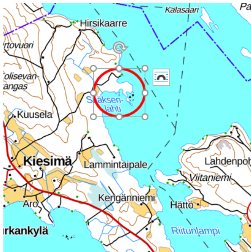
Kuva 1: Kaavamuutosalueen sijainti (punainen ympyrä/soikio).

Rantaosayleiskaavan muutos koskee tilaa 686-409-12-40 ja yhteistä vesialuetta 686-409-876-1.